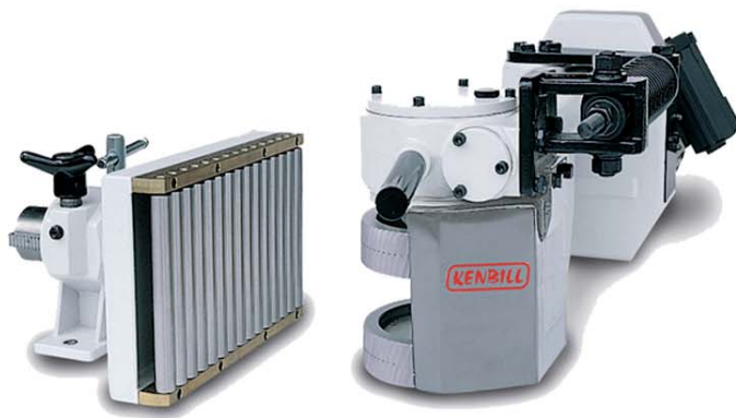
ALIMENTADOR DE PIÑA AL-19 N

Para sierras de cinta con pisador neumático de apertura automática.