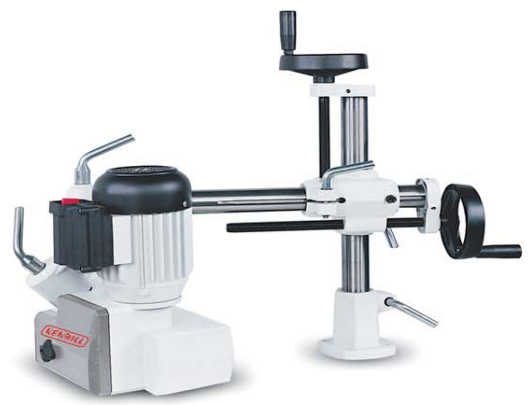
AL-32 SERIE BABY Pequeño alimentador especial combinadas