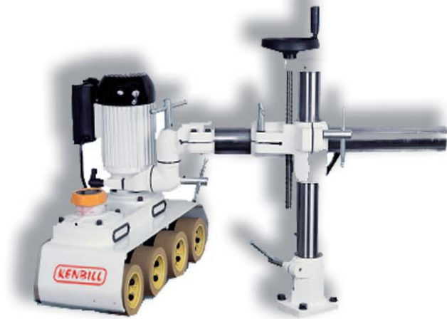
AL-40 CON VARIADOR