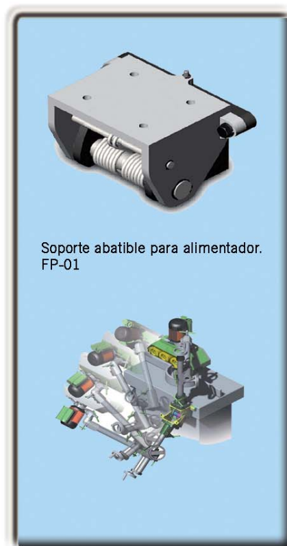
Soporte abatible para alimentador. FP-01